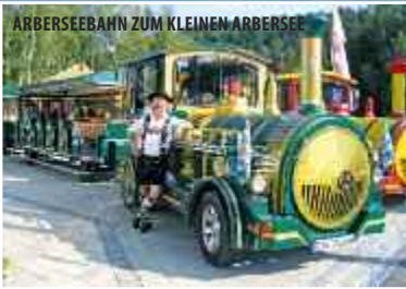
ARBERSEEBAHN ZUM KLEINEN ARBERSEE