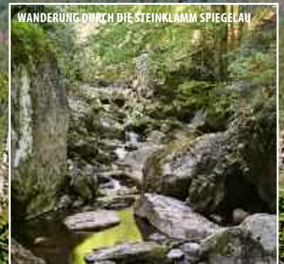
WANDERUNG DURCH DIE STEINKLAMM SPIEGELAU