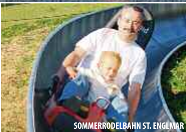
SOMMERRODELBAHN ST. ENGLMAR